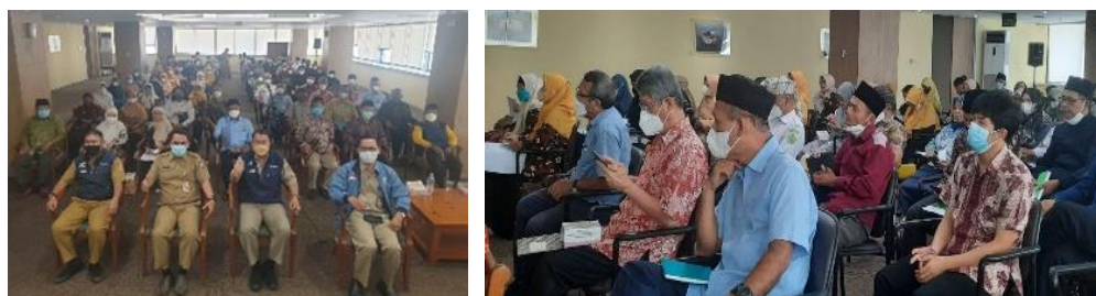
Gambar 2. Sosialisasi Pencairan dan Pertanggungjawaban Dana Hibah

Agar tujuan dari kebijakan pemberian dana hibah dapat bermanfaat sesuai dengan tujuannya, maka sebelum proses pencairan Biro Dikmental melaksanakan sosialisasi terkait proses pencairan termasuk maksud dan tujuan pemberian hibah dalam rangka menopang program pemerintah daerah melalui Ormas/Lembaga Keagamaan untuk membantu pembangunan mental spiritual warga DKI Jakarta.