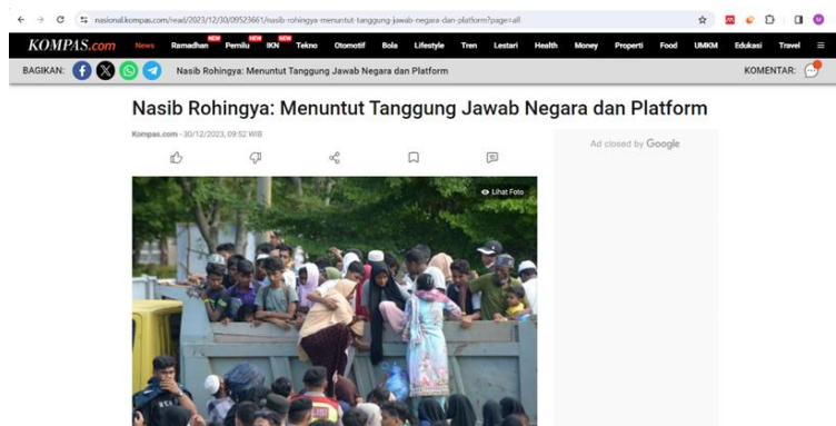
Gambar 2. Pemberitaan Pengungsi Rohingnya di Kompas.com

Penyelesaian masalah ( Treatment Recommendation ) pada pemberitaan tersebut adalah bahwa setiap masyarakat yang senang maupun tidak dengan kehadiran pengungsi Rohingnya dapat berpartisipasi untuk memberikan bantuan dan pertolongan kepada pengungsi Rohingnya, karena dari Hadist Rasulullah SAW menyampaikan bahwa barang siapa yang beriman kepada Allah SWT, hendaklah untuk memuliakan tamu yang datang.