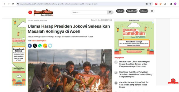
Gambar 1. Pemberitaan Pengungsi Rohingnya di Republika.co.id

Penyebab masalah ( Define Problems ) dari pemberitaan tersebut adalah Presiden ke 7 Republik Indonesia, Joko Widodo diharapkan untuk menyelesaikan permasalahan pengungsi Rohingnya yang ada di Aceh. Dalam hal ini Ketua Majelis Permusyawaratan Ulama (MPU) Faisal Ali memohon kepada Presiden Joko Widodo dan Pemerintah Pusat untuk menyelesaikan permasalahan pengungsi Rohingnya yang ada di Aceh. Pemerintah Pusat di harapkan sebagai pihak yang bertanggung jawab karena merupakan masalah sosial yang sangat berdampak bagi pengungsi Rohingnya tersebut.