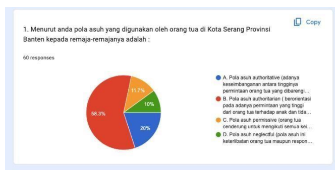
Gambar 1. Hasil Pra Riset

Membahas lebih lanjut tentang bagaimana pola asuh yang diterapkan di Kota Serang, peneliti telah melakukan pra-riset mengenai pola asuh yang banyak digunakan oleh orang tua kepada remaja di kota ini. Hasil pra-riset menunjukkan bahwa dari 60 responden yang mewakili beberapa masyarakat Kota Serang, sebanyak 58,3% menganut pola asuh otoriter.