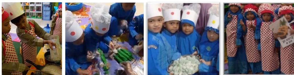
Figure 3. Kegiatan Fun Cooking di TKIT Wahdah Islamiyah 01 Makassar

Pada kegiatan fun cooking produk yang dihasilkan berupa makanan dengan menu yang berbeda-beda dan tentunya alat dan bahan yang digunakan juga berbeda. Hal yang menarik dalam penyediaan alat dan bahan guru melibatkan orangtua dalam mendukung terlaksananya pembelajaran berdiferensiasi dengan sebahagian besar bahan dan peralatan untuk kegiatan fun cooking diperoleh dengan kerjasama orangtua peserta didik. Produk atau hasil karya dari kegiatan fun cooking ini adalah bagaimana kreasi setiap kelompok dalam penyajian hasil olahan masakan khas daerah Makassar yang terdiri dari empat jenis masakan yaitu kelompok satu : coto makassar (6 anak), kelompok dua : pisang ijo (6 anak), kelompok tiga : onde-onde (4 anak) dan kelompok empat : pisang eppe (4 anak). Setelah produk karya anak di sajikan selanjutnya setiap kelompok akan mempresentasikan/menjelaskan produk masakannya sesuai dengan pemahaman yang mereka peroleh dari pengalaman belajarnya. Dan terakhir anak dipersilahkan untuk menikmati hasil produk dari masakan yang telah dibuat dengan saling bertukar makanan sesuai dengan selera masing-masing.