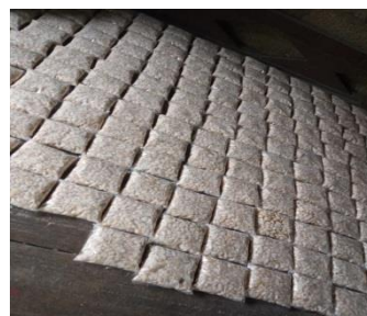
Gambar 3 Potensi Ekonomi (Tahu dan Tempe)

Beberapa gambar di atas merupakan hasil observasi langsung yang di lakukan kelompok pengabdian di lokasi pengabdian. Gamabar diatas menunjukkan salah satu potensi yang di miliki desa tempat pelaksanaan tim pengabdian yaitu Sumber Daya Alam dan potensi ekonomi yang terdapat Desa Bina Baru. Potensi inilah yang bisa memenuhi kelanjutan masyarakat setempat. Akan tetapi terdapat salah satu kendalanya yaitu kurang berkembangnya. Jika masyarakat bisa mengembangkan maka bisa masyarakat bisa menciptakan kesejahteraan.