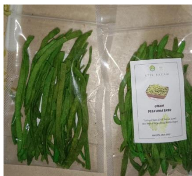
Gambar 5 (b) Produk Stik Bayam