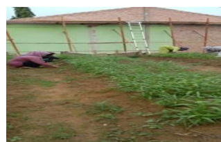
Gambar 2 Potensi SDA (Lahan Bayam dan Kangkung)