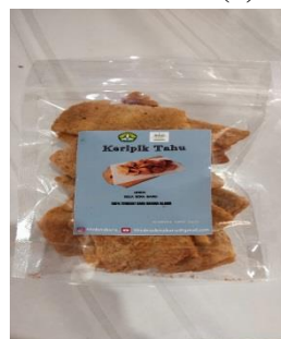
Gambar 5 (a) Produk Kripik Tahu dan Neugett Tempe