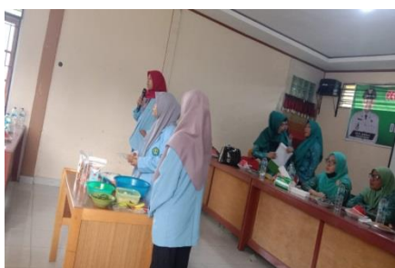
Gambar 4 (a) Pelatihan Tahu dan Tempe

Pelatihan selanjutnya yang dilakukan ialah pelatihan pengolahan dari tahu dan tempe menjadi produk olahan kripik tahu dan nugeet tempe. Sama halnya dengan pelatihan sebelumnya, pada pelatihan ini kelompok pengabdian menyiapkan alat dan bahan terdahulu sebelum terlaksananya pelatihan. Pelatihan dengan memberikan pengetahuan serta keterampilan yang di lakukan praktek langsung.