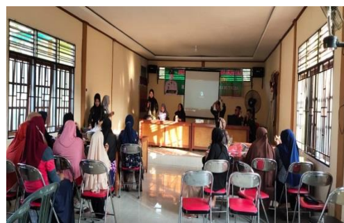
Gambar 4 (b) Pelatihan Stik Bayam