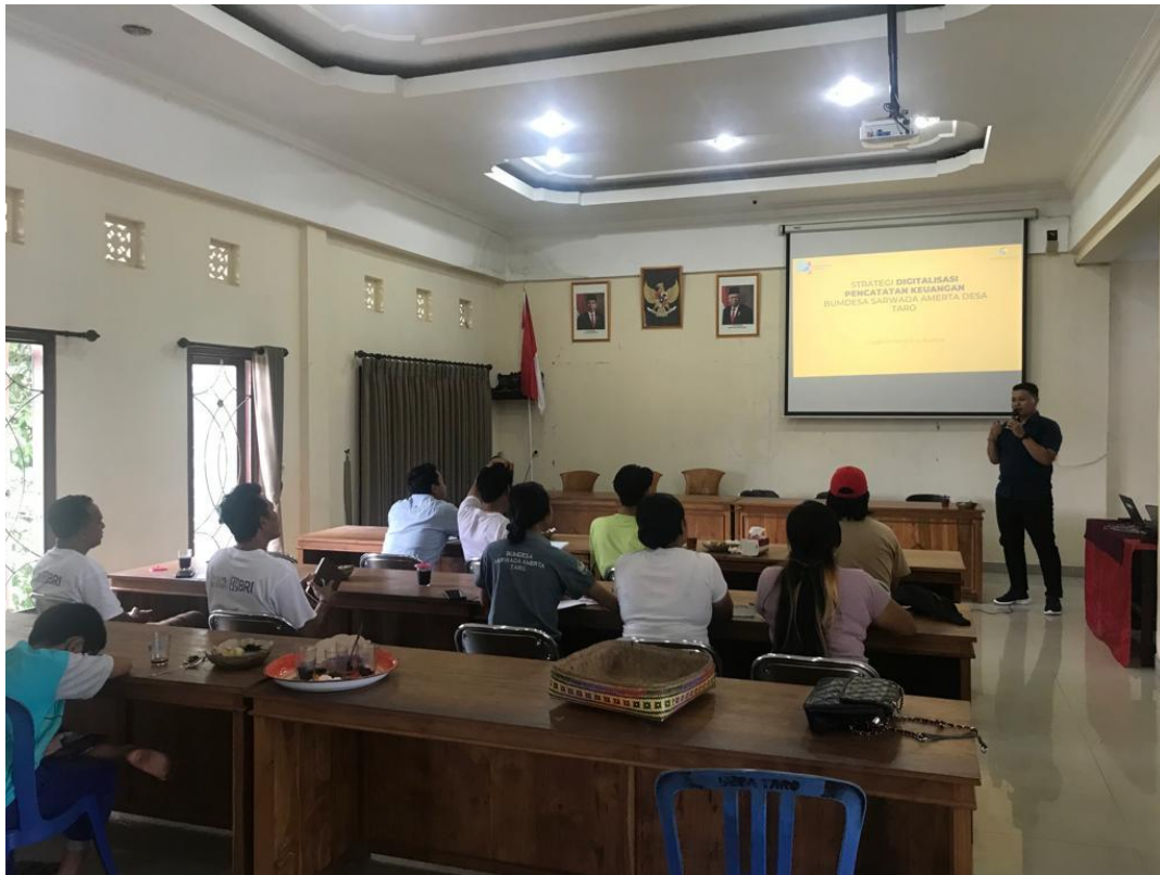
Figure 5. Pemaparan Materi Analisis Data Keuangan dan Uji Coba Penerapan Sistem Informasi Pencatatan Keuangan oleh Tim Pengabdian

keuangan untuk pengambilan keputusan bisnis agar lebih objektif, berdasarkan data yang didapatkan dari hasil pencatatan yang telah dilakukan melalui sistem informasi keuangan. Secara garis besar dalam pendampingan ini peserta dapat memahami penyesuaian yang perlu dilaksanakan dalam pengelolaan keuangan pasca penerapan sistem informasi pencatatan transaksi keuangan nantinya serta potensi yang dapat dimanfaatkan kedepannya. Figure 5 menampilkan dokumentasi kegiatan pemaparan materi serta Table 1 . Deskripsi Potensi Peningkatan Nilai Setelah Kegiatan Pengabdian menampilkan deskripsi dari potensi peningkatan nilai yang dihasilkan dari kegiatan pengabdian ini setelah penerapan sistem informasi pencatatan transaksi keuangan yang diujicobakan.