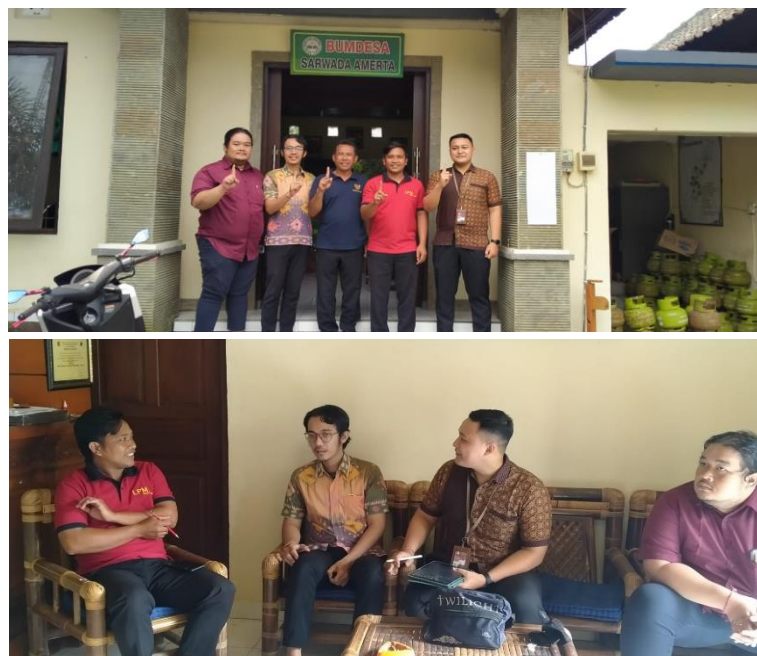
Figure 3. Kunjungan dan Diskusi Analisa Situasi Mitra dan Kebutuhan Sistem