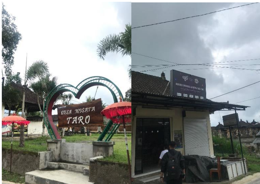
Figure 1. Gambaran Kunjungan Tim Pengabdian ke BUMDesa Taro

Oleh karena itu berdasarkan hal tersebut, pada program pengabdian masyarakat ini akan dikembangkan suatu sistem pencatatan transaksi keuangan berbasis website sebagai upaya digitalisasi pencatatan keuangan BUMDesa (Andarsari & Dura, 2018; Erlina & Sirojuzilam, 2020). Selanjutnya akan diadakan pendampingan pemanfaatan sistem informasi, pelatihan sumber daya untuk pengelolaan keuangan secara standar (Setyobakti, 2018; Sudirno et al., 2020), serta pelatihan penyusunan strategi pengambilan keputusan bisnis berdasar data keuangan (Agustino et al., 2022). Harapannya melalui program pengabdian ini, BUMDesa Sarwada Amerta dalam pengelolaan bisnisnya menjadi semakin profesional, yang secara tidak langsung akan berdampak pada kesejahteraan masyarakat di Desa Wisata Taro (Dewi, 2014; Pradana & Fitriyanti, 2019; Salihin, 2021).