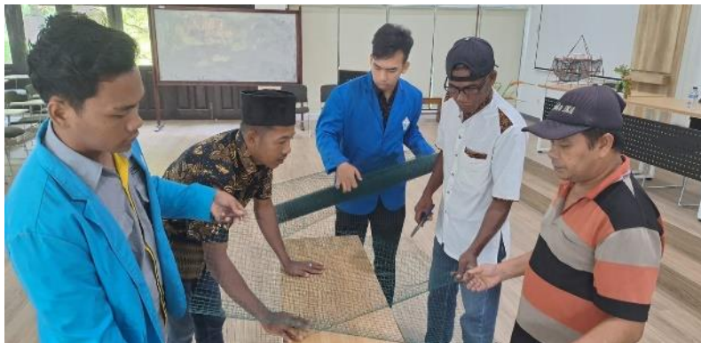
Gambar 1. Proses penentuan ukuran dan pemotongan kawat untuk alat tangkap bubu

Sebelum dilakukan pembuatan alat tangkap bubu, pertama-tama yang disiapkan adalah alat dan bahannya, terdiri dari gunting atau pemotong kawat, kawat sebagai bahan utama bubu, benang untuk mengikat bubu dan sambungannya, serta tali plastik sebagai tali pelampung atau tali penanda bubu nantinya saat dioperasikan di lapangan. Adapun langkah-langkah dalam pembuatan bubu yaitu diawali dari penentuan ukuran baik itu ukuran panjang dan lebar dari bubu, dalam hal ini menghitung jumlah mata pada kawat yang digunakan. Setelah ukuran sudah diperoleh, kemudian dilakukan pemotongan kawat tersebut menjadi 6 potongan atau bagian yang nantinya akan dirangkai menjadi satu kesatuan alat tangkap bubu. Setelah bagian-bagian keseluruhan bubu telah disiapkan, selanjutnya dilakukan penyambungan atau penyatuan satu dengan yang lainnya, sampai menjadi satu unit alat tangkap bubu. Bubu dirangkai dan di kencangkan menggunakan benang yang dimasukan atau diselipkan pada sisi-sisi mata kawat, sehingga tidak mudah terlepas atau rusak.