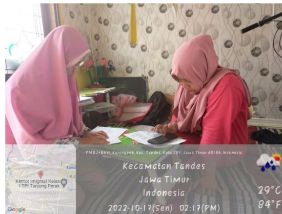
Gambar 3. Pendampingan RT KALIMASADA dalam pembuatan KK

Kegiatan lain yang dilakukan yaitu permohonan Kartu Keluarga (KK). Permohonan kartu keluarga dapat berupa perubahan KK berbarcode, pindah masuk, kehilangan KK, dan perubahan biodata. Pada perubahan KK barcode dapat melampirkan KK asli. Kemudian untuk pindah masuk dapat melampirkan persyaratan berupa surat keterangan RT RW, SKPWNI, KTP yang bersangkutan, buku nikah (jika sudah menikah), formulir pendaftaran, lampiran foto pemohon di depan rumah, dan surat pernyataan apabila pemohon menumpang KK/kontrak/kost. Khusus pindah masuk, pemohon harus datang langsung ke kelurahan karena akan ada verifikasi tempat tinggal dari petugas kelurahan secara langsung. Jika ada warga yang kehilangan KK dapat melampirkan surat keterangan hilang dari kepolisian. Selanjutnya jika ada perubahan biodata seperti penambahan title atau pekerjaan dapat melampirkan bukti yang akan dirubah dan KK asli.