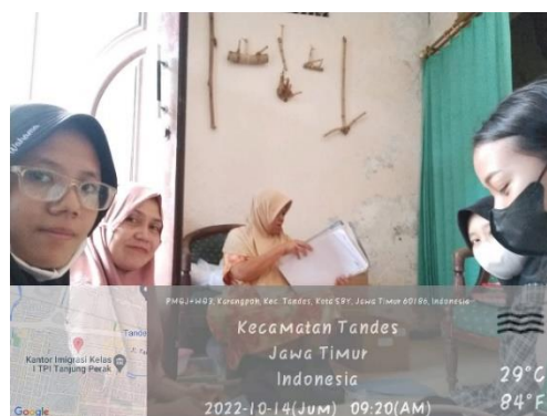
Gambar 2. Pendampingan RT KALIMASADA saat jemput bola pembuatan akta kelahiran

Mahasiswa melakukan kegiatan pendampinga berupa pengajuan pembuatan akta kelahiran dan akta kematian bagi warga yang belum memiliki akta atau ada kesalahan pada dokumen. Jika warga belum memiliki akta kelahiran dapat memenuhi persyaratan berupa sptjm kelahiran atau surat dokter, sptjm suami istri atau buku nikah orang tua, kk, dan fotokopi ktp 2 saksi Surabaya. Jika terdapat kesalahan pada nama atau tanggal dan tempat lahir di akta kelahiran dapat diajukan perubahan dengan menyertakan minimal 3 bukti yang benar seperti ijazah SD, SMP, SMA, atau buku nikah yang bersangkutan. Akta kematian dapat diajukan dengan malampirkan surat keterangan dokter/sptjm kematian, KK asli, dan fotokopi ktp 2 saksi.