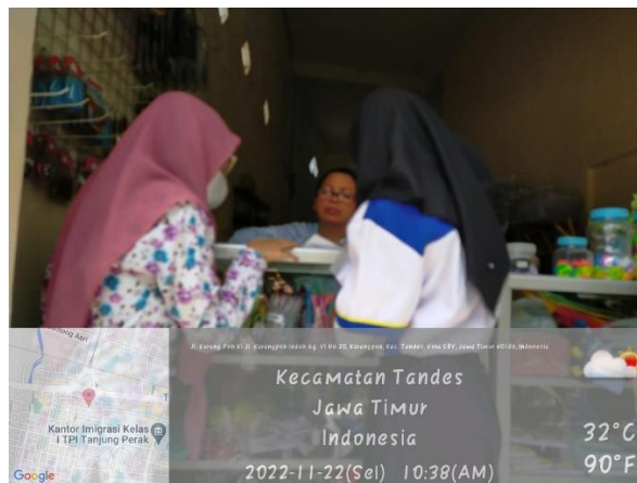
Gambar 4. Pembagian KIA ke Warga

Selain pengajuan akta dan kartu keluarga, ketua RT KALIMASADA juga dapat mengajukan KIA (Kartu Identitas Anak) untuk anak yang belum memiliki KIA. KIA digunakan mulai bayi lahir sampai umur 17 tahun sebelum memiliki KTP. Mahasiswa akan mendampingi RT KALIMASADA dalam membuat KIA serta membagikan KIA ke warga yang sudah mengurus KIA. Syarat untuk membuat KIA yaitu melampirkan fotokopi akta anak, fotokopi kk, fotokopi raport, foto 3x3 dengan background bebas, NPSN sekolah, dan form pembuatan KIA. Khusus KIA untuk bayi baru lahir akan otomatis tercetak saat membuat akta kelahiran.