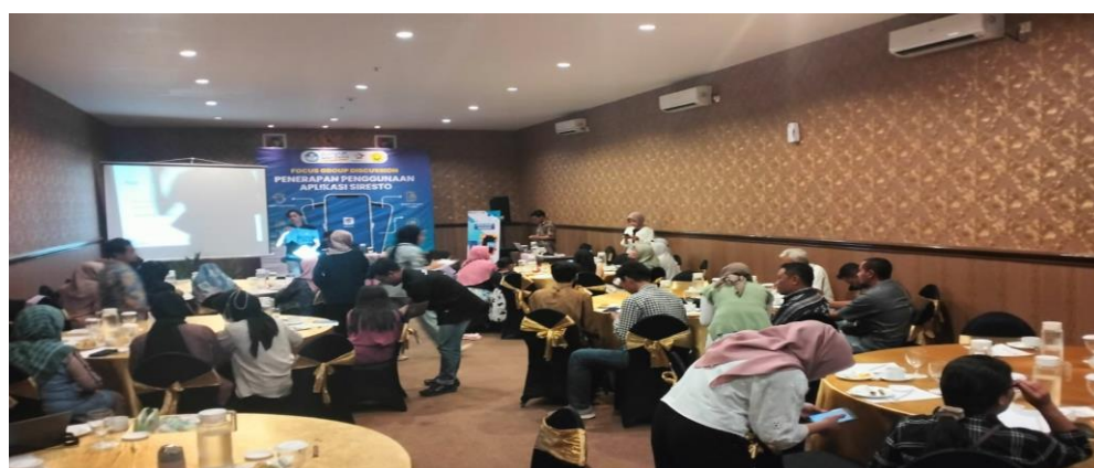
Gambar 4. Sosialisasi Penerapan Aplikasi SIRESTO

Kemudian dilanjutkan memberikan gambaran media yang bisa digunakan untuk mempermudah pelaku usaha restoran dalam melakukan pencatatan keuangan, seperti menggunakan sistem digital atau aplikasi. Aplikasi yang ideal, praktis dan mudah digunakan yaitu aplikasi SIRESTO yang dapat diakses melalui android dan mobile. Sehingga memudahkan para pelaku usaha untuk melakukan pencatatan keuangan sehari-hari. Aplikasi SIRESTO ini didesain berdasarkan kebutuhan para pelaku usaha, oleh karena itu pada kegiatan sosialisasi ini juga membuka saran dan masukan dari pelaku usaha di Kabupaten Banyuwangi terhadap aplikasi SIRESTO.