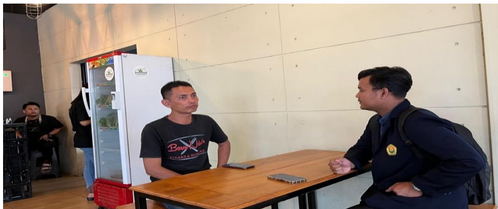
Gambar 2. Wawancara dengan Pelaku Usaha Restoran

Berdasarkan hasil survei dan wawancara diketahui bahwa 95% pelaku usaha restoran yang sudah melakukan pencatatan keuangan baik secara manual maupun menggunakan aplikasi menyampaikan memiliki kendala. Kendala yang mereka alami yaitu adanya pencatatan setiap harinya dan harus direkap ulang kembali di akhir bulan, hal itu yang membuat pemilik/pengelola restoran mengeluh dan terkadang lupa tidak melakukan pencatatan sehingga mereka kesusahan apabila dalam akhir bulan pencatatan tidak sesuai. Dari pemilik/pengelola restoran yang menggunakan pencatatan melalui aplikasi seperti dalam Aplikasi “Kasir Pintar” kendala yang mereka alami adalah harus update aplikasi setiap bulannya. Jadi, dari masing-masing jenis pencatatan yang digunakan restoran di Banyuwangi memiliki kendala-kendala yang berbeda. Sedangkan, untuk 5% pelaku usaha restoran di Kabupaten Banyuwangi menyampaikan tidak terdapat kendala dalam melakukan pencatatan keuangan.