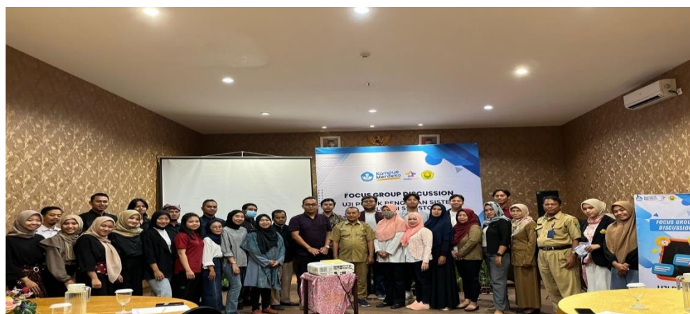
Gambar 3. Focus Group Discussion (FGD) Penggunaan Aplikasi SIRESTO

SIRESTO. Dengan melalui diskusi yang panjang dengan para pelaku usaha restoran beserta beberapa saran dan masukan tambahan untuk Tim IT guna mengembangkan aplikasi SIRESTO.