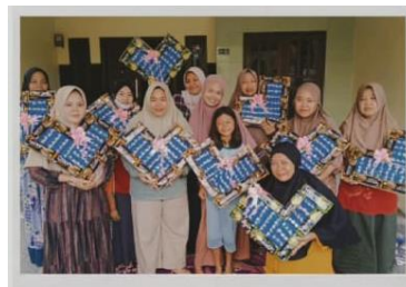
Gambar 2. Hasil Kreasi Snack Love Bouquet Peserta

Berdasarkan pada rangkaian kegiatan pelatihan pada Gambar 1 dan Gambar 2, terlihat bahwa kegiatan ini dapat diterima dan diaplikasikan oleh peserta dengan sikap kooperatif dalam mengikuti acara pelatihan. Hanya saja peserta pelatihan belum bisa memberikan gambaran ide peluang bisnis lainnya di bidang ini pada saat acara pelatihan berlangsung, dan masih harus menghitung secara detail kembali untuk taksiran harga dari kreasi yang telah dibuat.