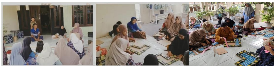
Gambar 1. Rangkaian Kegiatan Pelatihan Pembuatan Snack Love Bouquet

Kreasi usaha yang dijadikan percontohan dalam kegiatan kewirausahaan ini mendapatkan respon positif oleh para peserta pelatihan, karena mereka menjadikan ini sebagai referensi dan merasa mudah untuk diterapkan dilain waktu setelah selesainya rangkaian acara pelatihan.