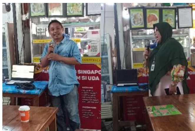
Gambar 3. Diskusi Interaktif

Pelaksanaan pelatihan ini melibatkan sesi interaktif yang menggabungkan teori dengan praktik, serta menggunakan studi kasus dan simulasi untuk memperkuat pemahaman peserta. Hal ini memungkinkan para pelaku UMKM untuk tidak hanya memahami konsep secara teori, tetapi juga mampu mengaplikasikannya dalam situasi nyata yang mereka hadapi sehari-hari. Para peserta menunjukkan respons yang positif dan antusiasme yang tinggi dalam mengikuti setiap sesi pelatihan.