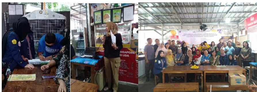
Gambar 2. Foto Kegiatan

Hasil analisis tersebut memperkuat dugaan bahwa literasi keuangan yang rendah menjadi faktor utama yang menghambat pertumbuhan dan stabilitas UMKM.