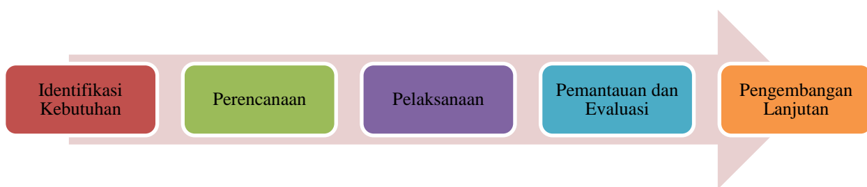
Gambar 1. Tahapan Kegiatan

Terakhir, dilakukan pengukuran hasil dari seluruh rangkaian PkM ini, dengan melihat perubahan yang terjadi pada UMKM Rufata, baik dari segi peningkatan produktivitas, efisiensi operasional, maupun kemampuan mereka dalam mengakses sumber daya ekonomi. Dengan pendekatan yang komprehensif dan terintegrasi ini, diharapkan UMKM Rufata dapat mengatasi berbagai tantangan yang dihadapi, sehingga mampu berkontribusi lebih signifikan terhadap perekonomian nasional.