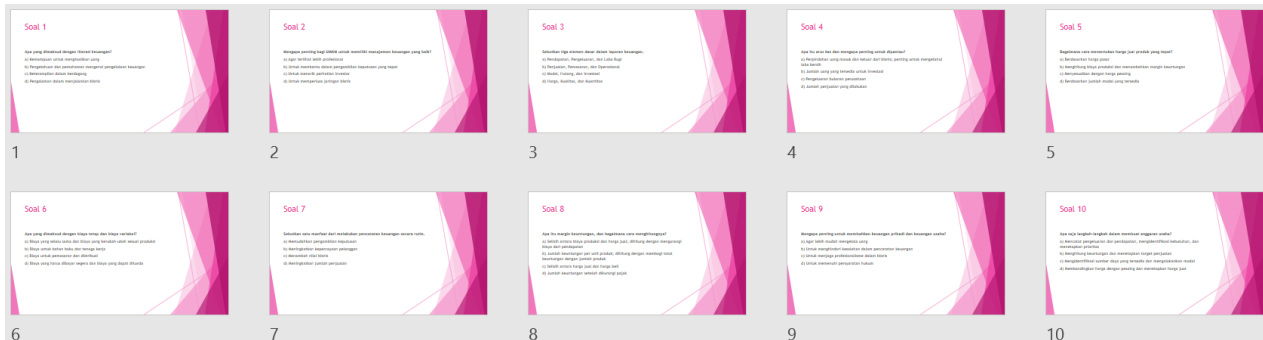
Gambar 4. Evaluasi Kegiatan