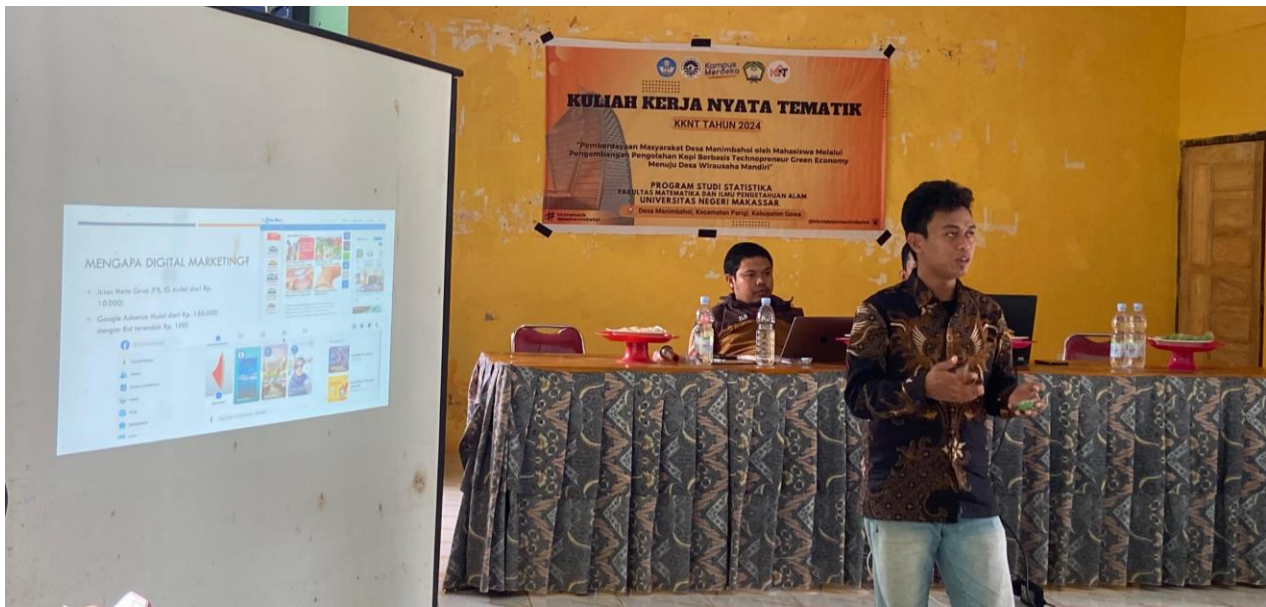
Gambar 3. Pemaparan materi terkait teknologi pemasaran