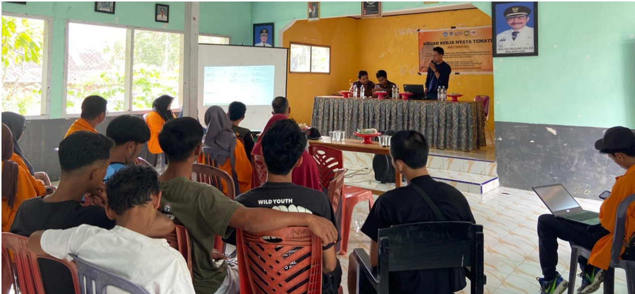
Gambar 2. Pemaparan materi terkait strategi pemasaran

Kegiatan ini dilakukan dengan tujuan untuk meningkatkan kualitas produk inovasi dengan membuat brand. Dengan adanya Brand ini akan memberikan ciri khas tersendiri terhadap produk yang telah dibuat dan tentunya akan berpengaruh terhadap nilai jualnya.