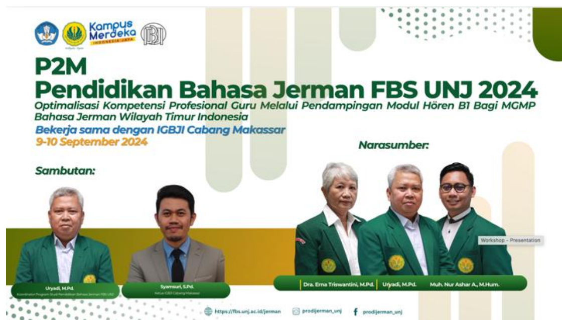
Gambar 1. Flyer Promosi Kegiatan P2M.

Setelah ditetapkan proses kegiatan dan jangkauan peserta oleh perwakilan guru dan dosen Program Studi Pendidikan Bahasa Jerman, selanjutnya didiskusikan terkait waktu pelaksanaan kegiatan pengabdian ini. Diskusi dilaksanakan melalui penyampaian pesan pada grup whatsapp guru bahasa Jerman dan pada diskusi tersebut disepakati bulan kegiatan dilaksanakan yaitu pada bulan September sehingga dalam persiapannya tim membuat spanduk untuk promosi kegiatan seperti pada gambar berikut ini