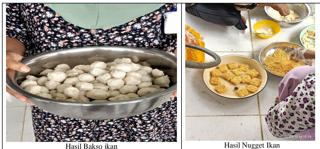
Gambar 5. Hasil Pengolahan Hasil Perikanan

Hasil pengolahan hasil perikanan di atas berupa bakso ikan dan nugget ikan dapat memberikan manfaat bagi ibu-ibu sebagai upaya perilaku ekonomi rumah tangga dalam meningkatkan pendapatannya. Menurut Ahsan dan Muhammad (2017) menjelaskan bahwa perilaku ekonomi individu atau rumah tangga merupakan satu unit terkecil yang berfungsi sebagai produsen sekaligus sebagai konsumen, dan rumah tangga yang melakukan kegiatan ekonomi dianggap bertindak rasional sesuai dengan kemampuan, kesempatan dan harapannya.