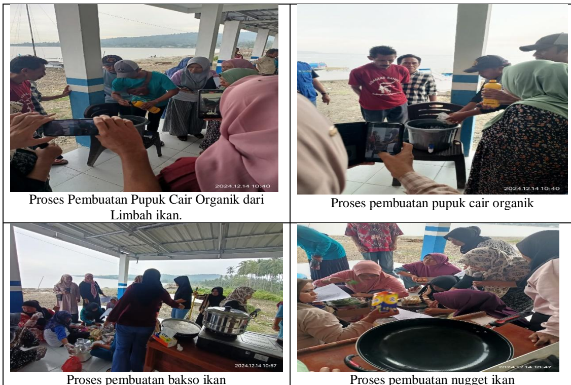
Gambar 4. Pelaksanaan Pengabdian

Sebelum demonstrasi pembuatan bakso ikan, nugget ikan, dan kelompok pembuat pupuk organik cair dari limbah ikan. Terlebih dahulu nara sumber menjelaskan tentang teknik kerja dan tahapan-tahapan pelaksanaannya. Proses dan pelaksanaan kegiatan disajikan dibawah ini: