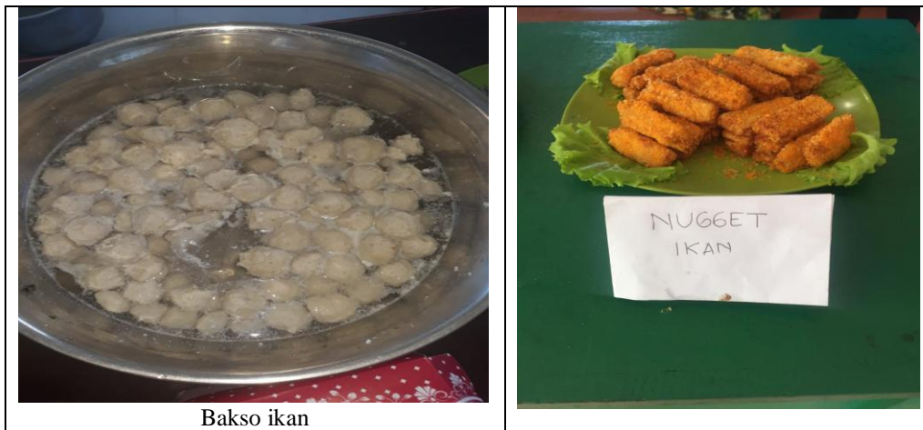
Gambar 2. Hasil akhir bakso ikan dan nugget ikan.

Deskripsi proses pembuatan bakso ikan, nugget ikan meliputi bahan: (1) ikan barracuda; (2) bahan rempa2 sesuai kebutuhan; (3) bahan pendukung lainnya. Hasil akhir bakso ikan dan nugget ikan dapat dilihat pada gambar 2.