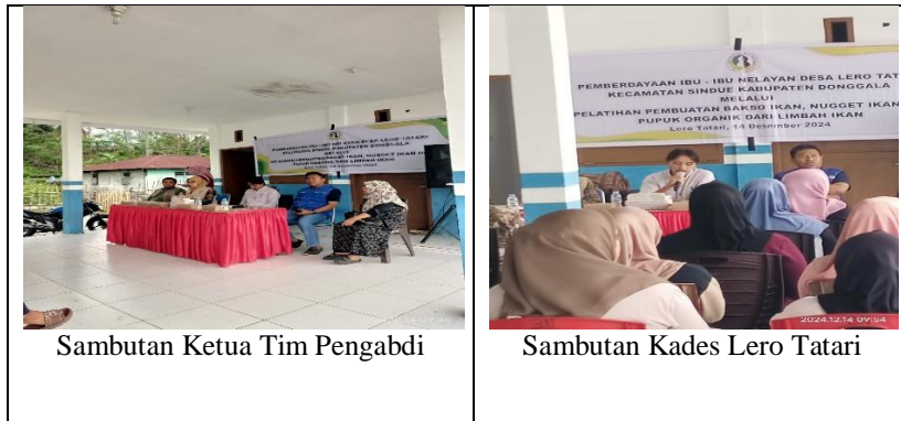
Gambar 3. Pembukaan Pelaksanaan Pengabdian

Kegiatan pengabdian di desa Lero Tatari setelah dibukan secara resmi oleh Kepala Desa Lero Tatari kemudian dilanjutkan dengan kegiatan pelatihan. Jumlah peserta yang hadir sebanyak 30 orang, dan dibagi dalam 3 kelompok yakni kelompok pelatihan bakso ikan, nugget ikan, dan kelompok pembuat pupuk organik cair dari limbah ikan.