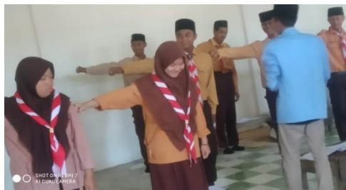
Fig. 1.5. Pelatihan public speaking

Langkah selanjutnya adalah implementasi pendampingan pelatihan public speaking untuk menjadi pembicara yang handal dan profesional, Karena minimnya waktu yang diberikan kepada tim pengabdian, maka pendampingan pelatihan ini dirasa belum maksimal sehingga siswa-siswa Madrasah Aliyah Sunan Drajat kedungadem bojonegoro juga kurang menguasai materi yang diberikan oleh tim pengabdian tersebut.