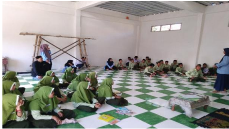
Fig. 1.4. Menentukan tujuan pendampingan public speaking

Tujuan ini dapat terus dikembangkan dengan menyesuaikan pencapaian yang telah diraih oleh anggota komunitas yang mendapat pendampingan. Karena memang Kegiatan pelatihan dilakukan terutama dalam rangka memprovokasi perubahan perilaku masyarakat peserta pelatihan.(N. Sari et al., 2018, pp. 1–8) Dengan begitu, Komunitas public speaking bisa terus mengembangkan dirinya secara konsisten.