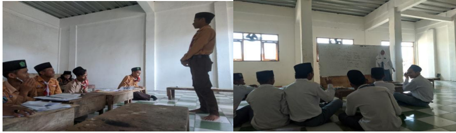
Fig. 1.6. Pelatihan peserta public speaking putra dan putri

Setelah pendampingan pelatihan ditahap ini, dengan bekal materi, wawasan dan praktek secara konsisten maka siswa-siswi peserta public speaking siap menjadi stakeholder dalam program pelatihan public speaking .