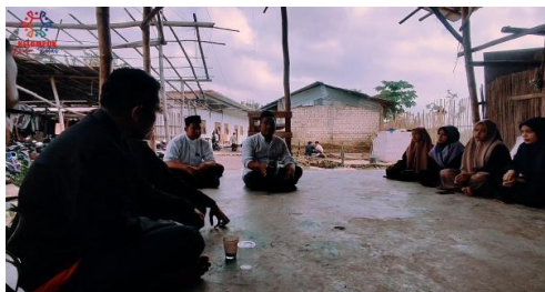
Fig. 1.1. Sosialisasi program public speaking dengan pihak terkait

Pondok Pesantren Alhamdulillah memiliki perhatian yang besar dalam dunia pendidikan. Lembaga pendidikan formal, non formal dan juga kegiatan ekstrakurikuler yang dikembangkan untuk membekali santri dengan pendidikan yang dibutuhkan. Lembaga pendidikan formal terdiri dari MTs Sunan Drajat, MA Sunan Drajat. lembaga pendidikan nonformal meliputi: Madrasah Qur'an, Madrasah Diniyah, Pengajian Kitab Salaf serta Program Tahfidz Al Qur'an. Kegiatan ekstrakurikuler antara lain: Sholawat Banjari, Pramuka, KSR PMI. Pesantren ini juga menyediakan asrama yang terpisah untuk santri putra dan santri putri di Pesantren Alhamdulillah yang mukim sekitar 160 santri putra putri yang berasal dari jenjang pendidikan yang berbeda-beda.