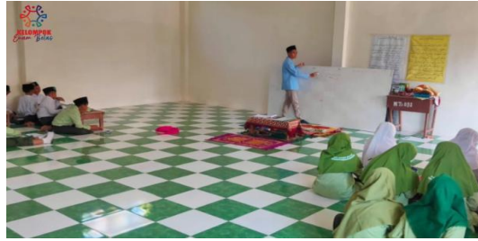
Fig. 1.2. Identifikasi impian peserta public speaking